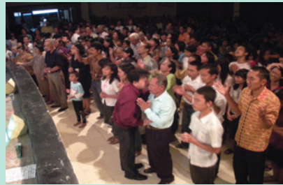
KKR Healing From Heaven